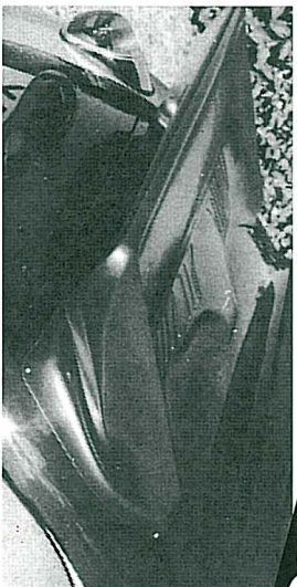
AUMANN-Heckflosse für Speedster mit TÜV